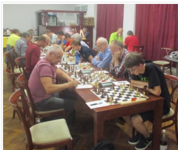
Turnaj Karviná Open 2018

Registrují se hráči a blíží se zahájení. Rum donesený jako pobídka pro organizátory došel. Blíží se šestnáctá hodina a hráči sedí na svých místech. PŘEKVAPENÍ! Začít ve stanovenou hodinu, to je na šachu v ČR málokdy k vidění.