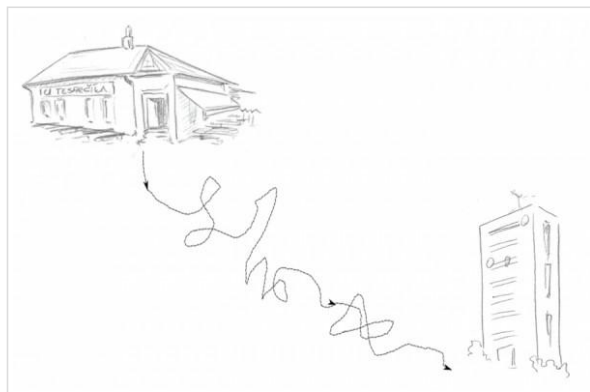
Cestička k domovu (Ilustrace: Luboš Zimniok)

Chci ještě sklidit šachy, ale závěr se dost podobá zahájení. Nechám to na pondělní dopoledne. Poslední věc, kterou si pamatuji, je grilovaná makrela a cesta domů.