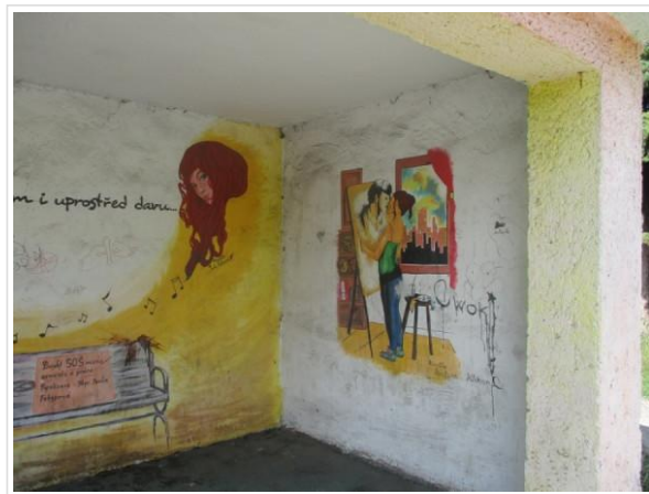
Karvinské grafiti

Jirka Hurta se před kolem rozplývá nad naším městem. Karviná se mu dostala hluboko pod kůži a píše oslavný článek Tam v Karviné .